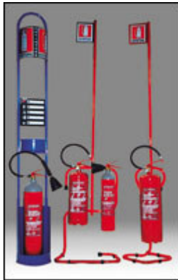
Piantane portaestintori singole, doppie o speciali per uffici