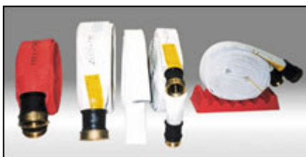
Manichette UNI 45, UNI 70 e speciali per utilizzi estremi (es. raffinerie, porti, az. chimiche)