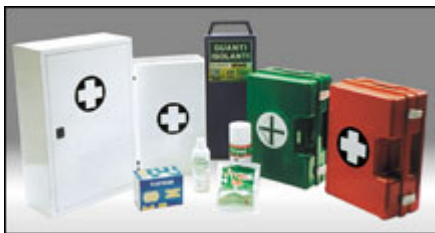
Cassette mediche, ricambi e attrezzature di primo soccorso