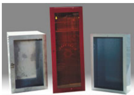
Cassetta UNI 45, UNI 70 e portaestintori in lamiera verniciata o in acciaio inox