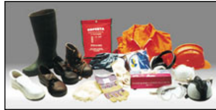
D.p.i. e articoli antinfortunistici