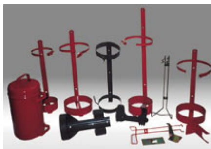
Secchielli portasabbia e supporti speciali per estintori (nautica, automezzi, uso interno o esterno)