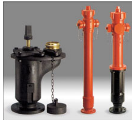
Idranti e colonnine, sopra e sottosuolo