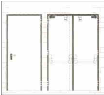
Porte e portoni tagliafuoco civili e industriali