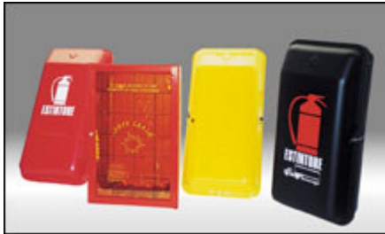
Cassette in pvc e abs antiurto, anticorrosione, inalterabili