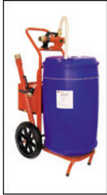
Gruppi schiuma mobili e liquidi schiumogeni in fustini e bidoni