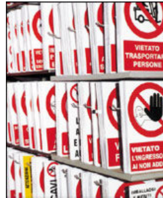
Cartellonistica di sicurezza standard e su misura