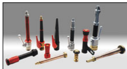
Lance UNI 45, UNI 70 e speciali per schiuma o acqua, monitori e miscelatori