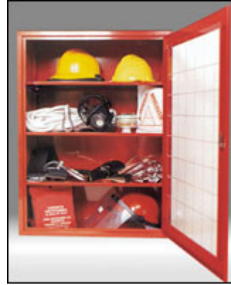
Armadi per attrezzature di sicurezza e presidi primo intervento