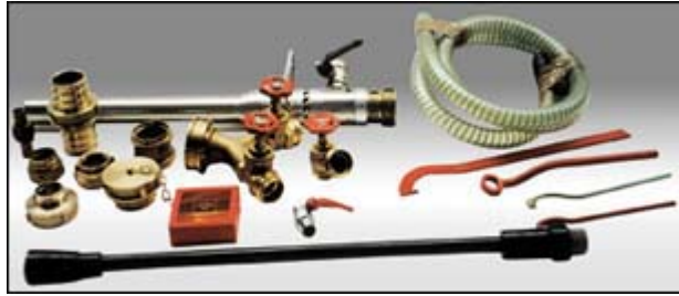
Raccorderia UNI / VV.F. e rubinetteria antincendio